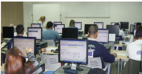
Centro Multifuncional de Información Marítima.