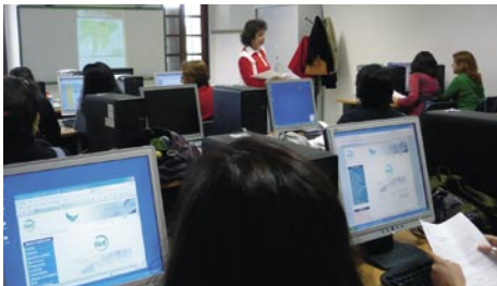
Bóvedas de Santa Elena Centro Homologado de FPO en 18 especialidades.