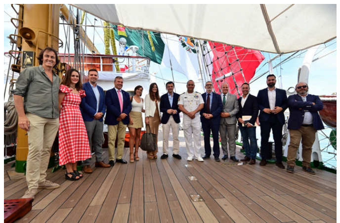
Jornada “La economía azul, una oportunidad para Cádiz”, durante la celebración de la Regata de Grandes Veleros