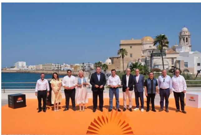
Presentación Festival Internacional de Series SOUTH