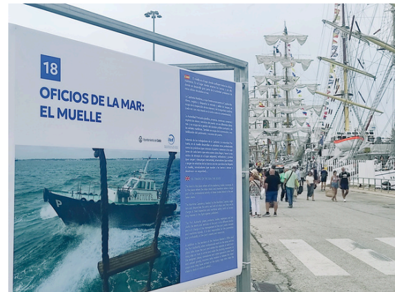
Exposición sobre la relación de Cádiz con el mar durante la celebración de la Regata de Grandes Veleros