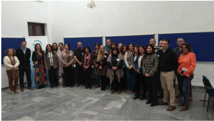
Participantes del Programa de Empleo y Formación de la convocatoria 2022