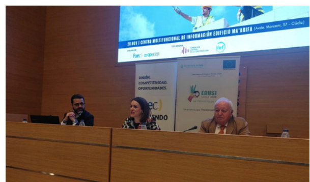
Jornada Construyendo empleo EDUSI