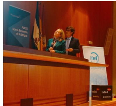
Jornada sobre inteligencia artificial durante el CILE