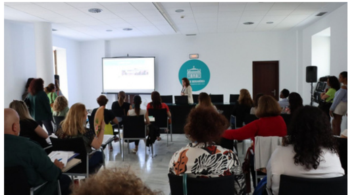
Participación de la Agencia municipal de Colocación en la Feria de Empleo de Cruz Roja