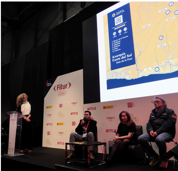
Participación de Cádiz Film Office en FITUR Screen