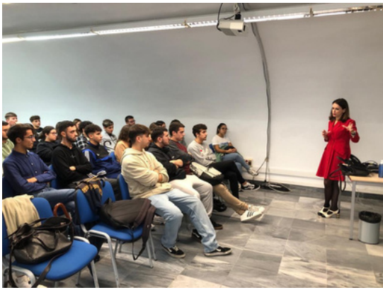
Recepción en IFEF del alumnado del IES Rafael Alberti