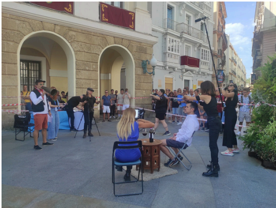
Acción callejera "Siente el cine" durante el Festival Internacional de Series SOUTH