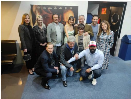
Estreno de la película “Lobo feroz”