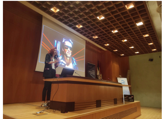
Presentación del Proyecto HAZ en el CILE