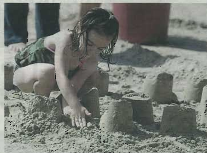
▲ Concentración. Una pequeña levanta las torres de su castillo y moldea con sus propias manos los que se convertirán en los muros de su particular recinto.

El concurso de castillos de arena congrega a decenas de participantes en la playa