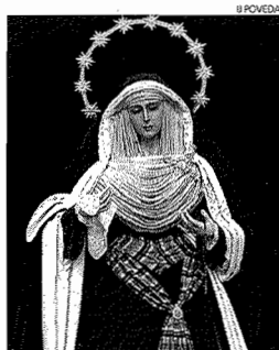
María Santísima de la Caridad.

El día 2 de septiembre, a las 20 horas tendrá lugar un acto de oración ante la Virgen de la Caridad,