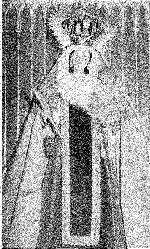
La Virgen del Carmen a la que le fue robada la corona.

Una de las cuestiones que más preocupa a las autoridades eclesásticas, y que supone un problema a la hora de mantener abierto los templos durante más tiempo, es su seguridad, puesto que no se puede tener una iglesia, que contiene siempre elementos de gran valor, abierta al público sin que haya algunas personas pendientes de que todo el patrimonio esté a buen recaudo. Al menos en esta ocasión el hurto ha acabado de la mejor manera, con la recuperación de la corona.