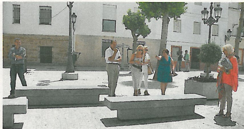
La alcaldesa visitó la plaza tras la culminación de los trabajos.

Hace unos días se adjudicaban las obras para los trabajos de jardinería en la nave 1 a la empresa José María Rodríguez Fernández por importe de 78.444 euros y un mes de plazo de ejecución. Con dichos trabajos se tiene previsto en la zona exterior ajardinada, junto acceso principal, regularizar la superficie del pavimento. También se retirará la chapa de uralita que está almacenada en el jardín exterior y las rejas metálicas que se trasladarán a Mantenimiento Urbano.